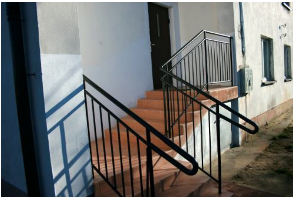
Przybudowane schody zewnętrzne