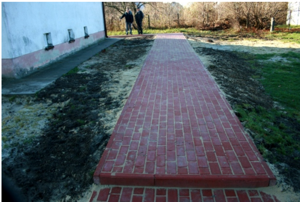
Nowo ułożony chodnik z kostki