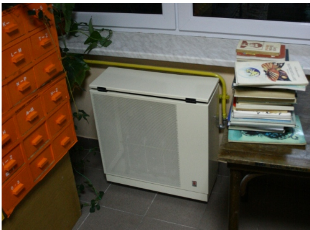
Wymiana piecyków gazowych