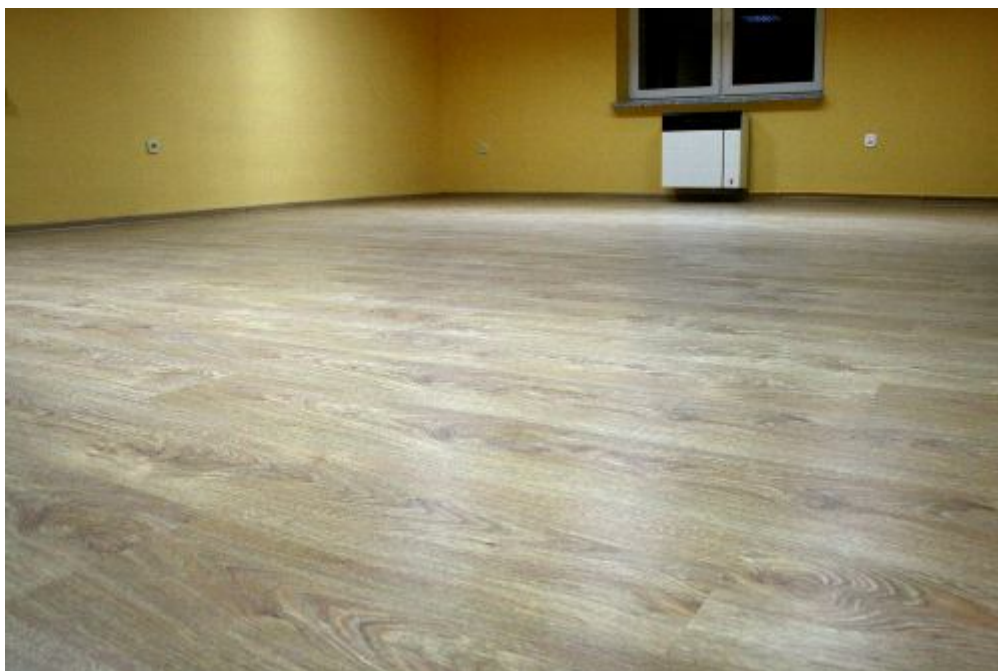
Nowo położone panele podłogowe