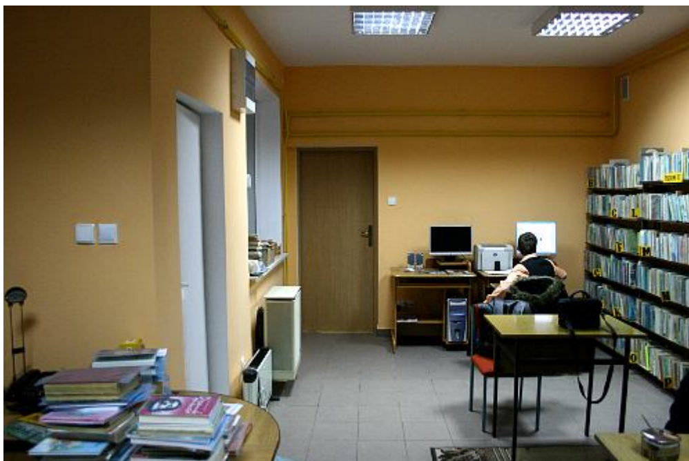
Wyburzenie ścian działowych i odnowienie wszystkich ścian