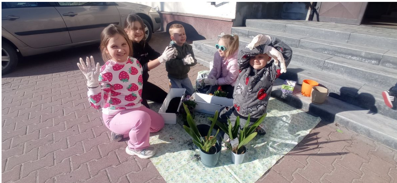
Zajęcia wiosenne 1