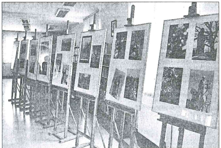
Zdjęcia poświęcone są tematowi przenikania się różnych światów.

Wystawa fotografii i spotkanie autorskie w jednym. To do zaoferowania miała kolbuszowska biblioteka tym, którzy przyszli do czytelnicy dziewiątego lutego.