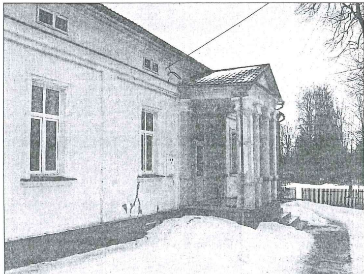
W tym roku Ognisko korzysta z gminnej dotacji.