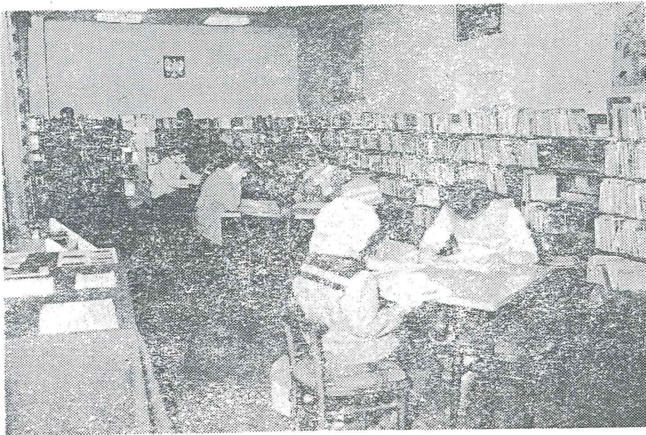
50. Czytelnia dla dzieci.

Oprócz bogatego księgozbioru biblioteka prenumeruje ponad 70 tytułów czasopism udostępnianych zainteresowanym czytelnikom. Czytelnikami jej są mieszkańcy Kolbuszowej i najbliższych okolic tego miasta, pracownicy różnych placówek: oświatowych, kulturalnych oraz młodzież szkolna różnych typów szkół. Wybór książek z danej dziedziny wiedzy ułatwiają katalogi: alfabetyczny rzeczowy i czasopism.