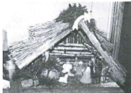
Nagrodzone szopki wykonane przez uczniów szkół podstawowych.