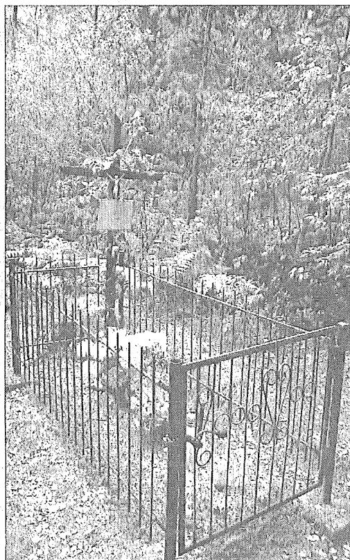
Władysław Piotrowski został pochowany w lesie. Fot. J. Radwański (2)